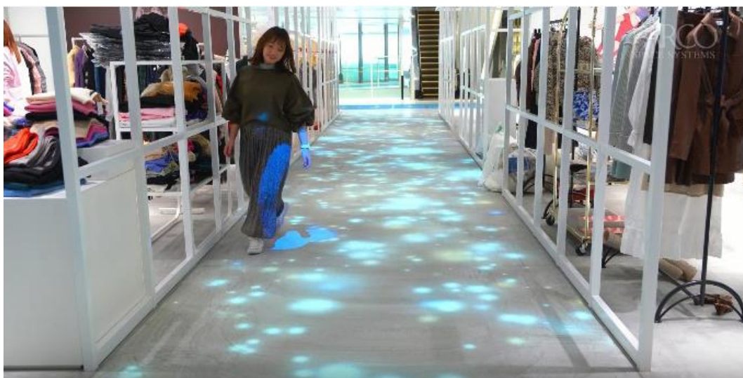
YouTube で動画を公開しています。 https://youtu.be/QDFcOLnrOIE

長さ約 18mの空間通路へ、各 4 台の高輝度プロジェクターとモーションセンサーをシームレスに連動させ、訪れる方の動きに追従して変化する「CUBE」の様々な映像コンテンツを体感いただけます。画一的になりがちな床面を最新デジタル技術でデザイン演出することにより、より豊かで変化感のある空間アピールが可能となります。