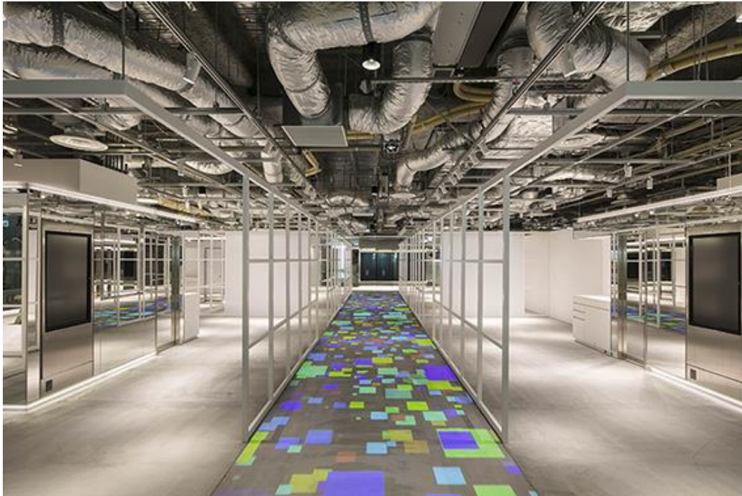
渋谷 PARCO 5F 「Root F(ルートエフ)」